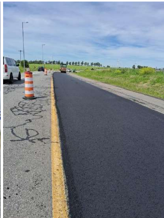
Imagen N°8 y 9: Reparaciones por rotura de calzada.