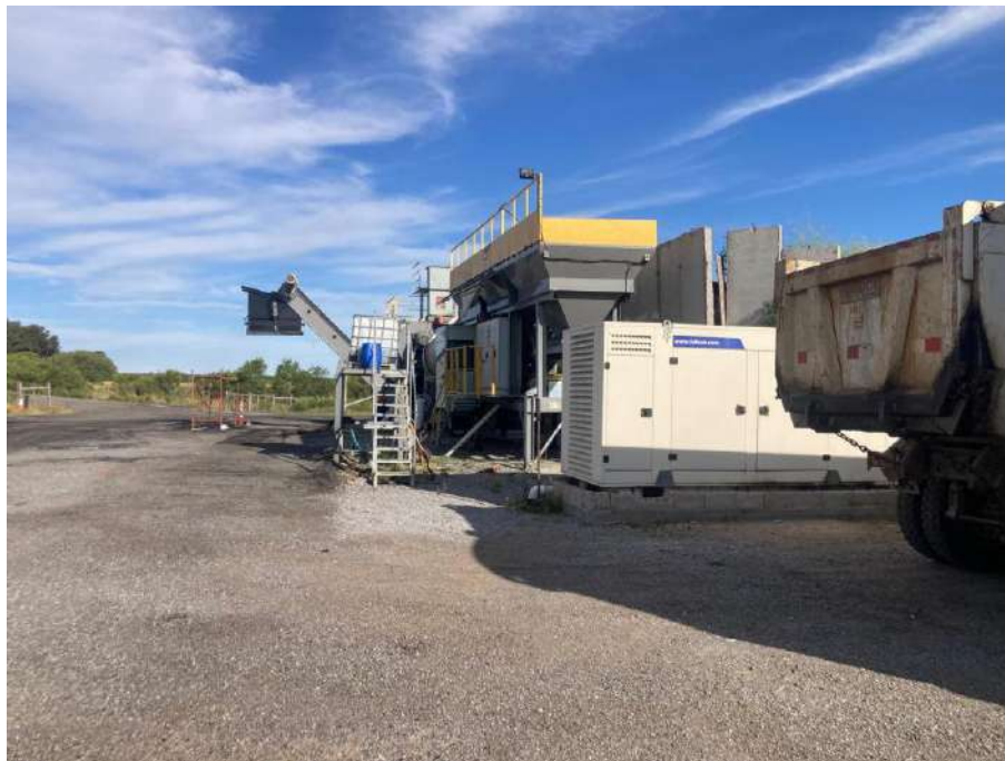
Imagen N°4 y 5: Planta asfáltica en el obrador antes de trasladarse (foto de diciembre 2025).