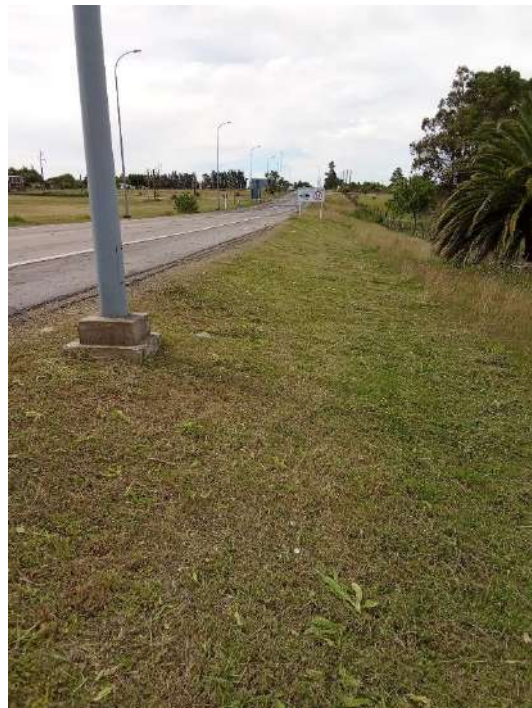
Imagen N°12 y 13: Corte de pasto y recolección de residuos en faja pública ruta 2, 12 y 23.