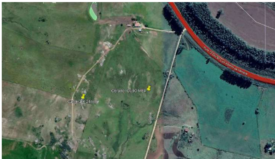
Imagen N°2: Ubicación Cantera padrón N° 24448 Colonia.

Se cuenta con la AAP y AAO de Ministerio de ambiente para la cantera de obra pública ubicada en el padrón 24448 de Colonia, se adjuntó en el 2do ITGA, la inclusión de Cantera de obra pública por parte del MTOP se presentó en el 1er ITGA.