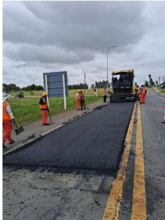
Imagen N°10 y 11: Bacheo parcial en calzada de rutas 2. Tareas extraordinarias de mantenimiento (TEM).