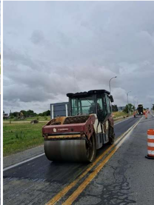
Imagen N°6 y 7: Reparaciones por rotura de calzada.