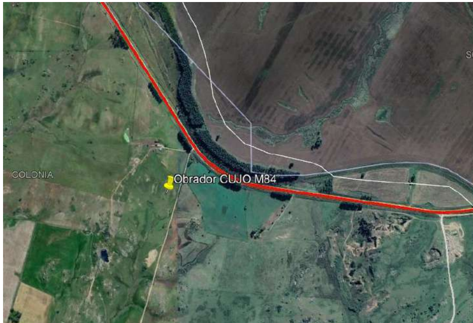
Imagen N°1: Ubicación del obrador.

En el presente trimestre en el frente de obra se ejecutaron las tareas de: