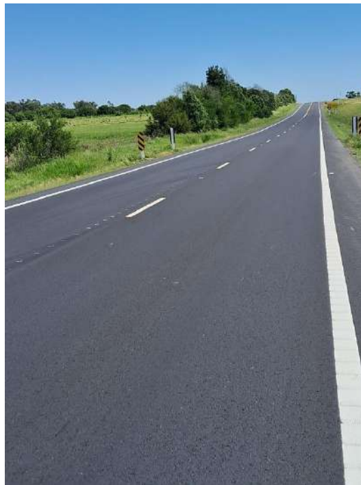
Imagen N°16: Mantenimiento de la señalización horizontal (Reposición de tachas faltantes) en rutas 2,12 y 23.