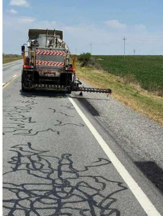
Imagen N°14 y 15: Reparaciones de banquina puntuales con tratamiento bituminoso simple en Ruta 2.