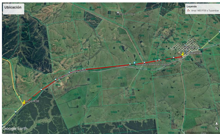
Figura 1: trazado proyectado.

En el marco de la obra Licitación M/83, fue aprobada una ampliación de dicha Licitación a efectos de adecuar en mezcla asfáltica la Ruta 7, en el tramo Ruta 38 (292k500) y Tupambaé (304k000)", según se indica en la figura 1.