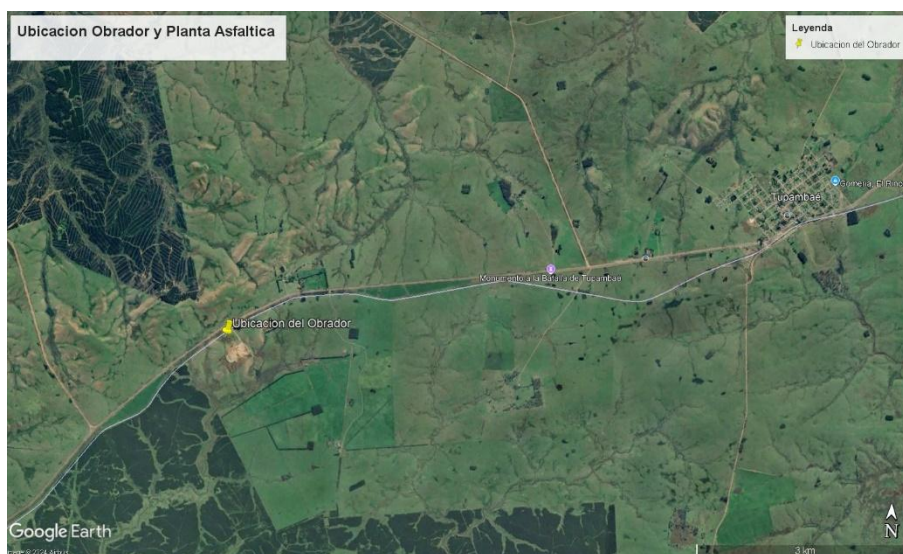
Figura 2: ubicación del obrador

El obrador cuenta con un baño químico de uso exclusivo de la administrativa y personal femenino, un baño químico de uso para personal masculino, los mismos son desagotados y limpiados por la empresa El Raval quien suministra los baños químicos, contenedores acondicionados para: oficina técnica y administración, oficina técnica para la Dirección de Obra, comedor y lugar de resguardo para el personal, pañol y recinto para almacenamiento de productos químicos.