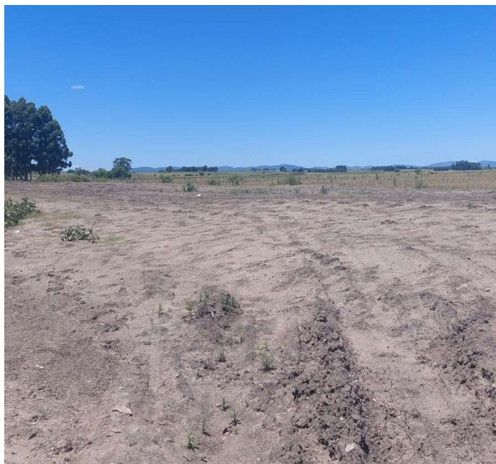
Ruta 81 hacia Minas