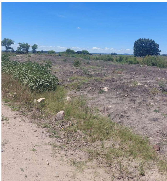
Ruta 81 hacia Minas