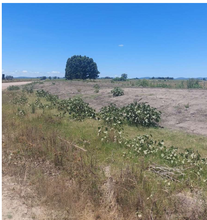
Ruta 81 hacia Minas