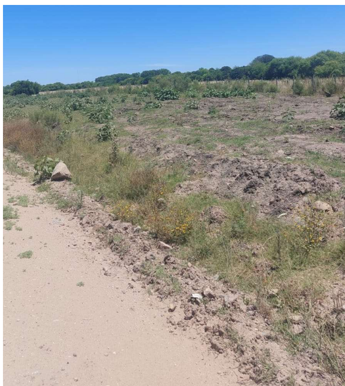
Ruta 81 hacia Montes