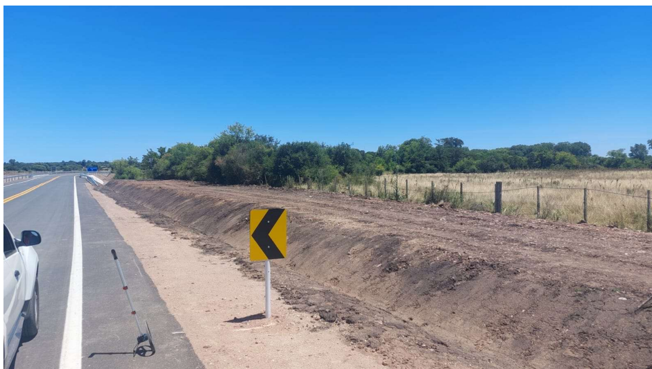
Ubicación del obrador de Saceem S.A.