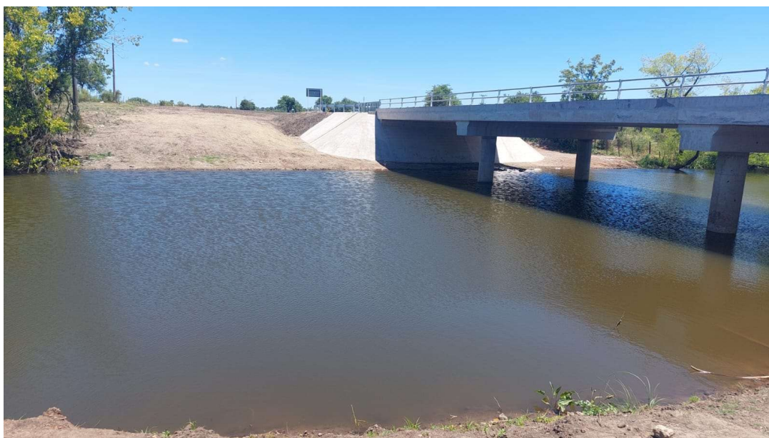
Arroyo Solís Grande aguas abajo