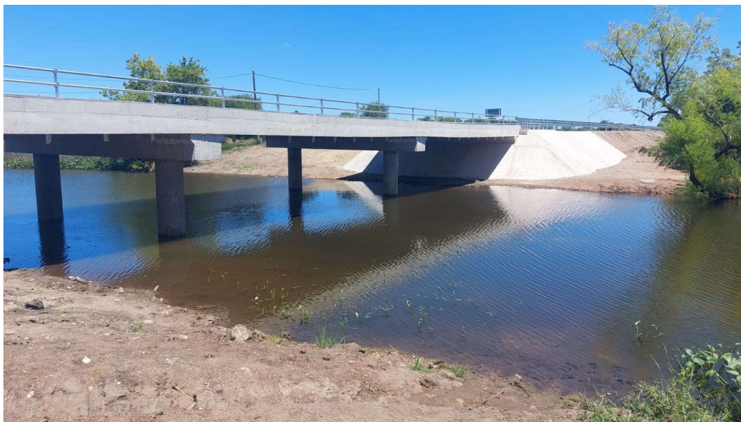
Arroyo Solís Grande aguas arriba