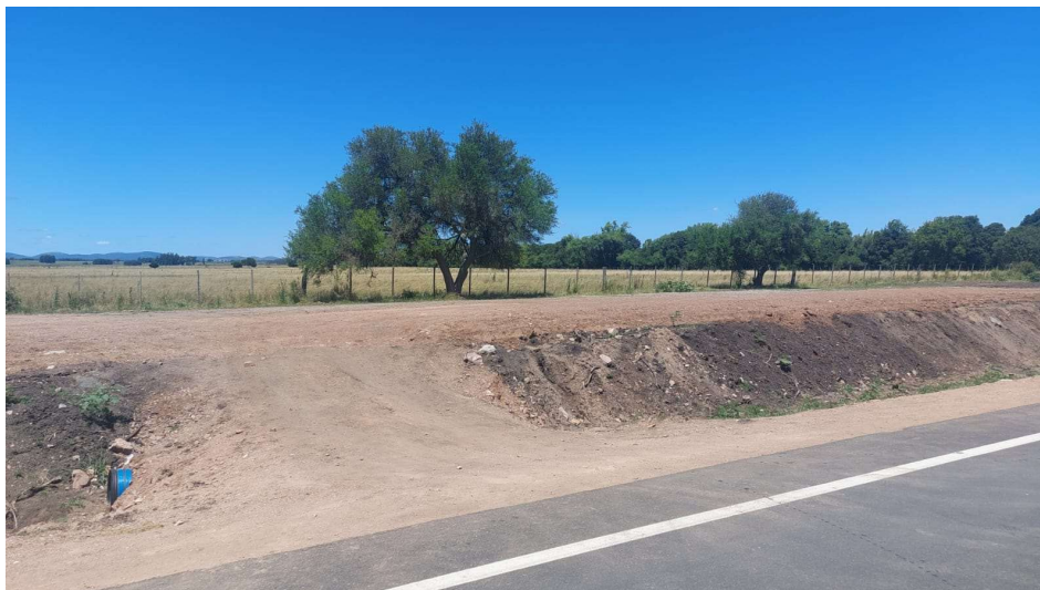
Ubicación del obrador de Molinsur S.A.