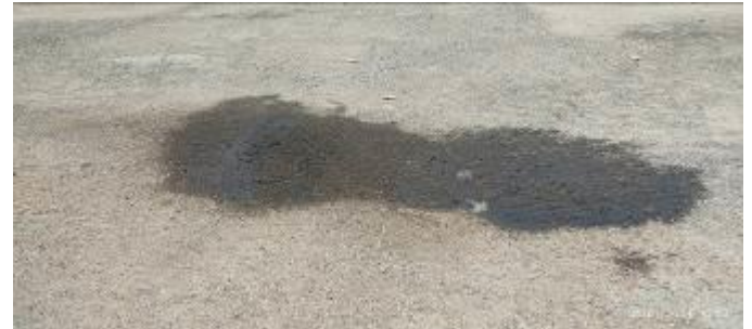
Foto 12.1-1 Derrames de hidrocarburo.