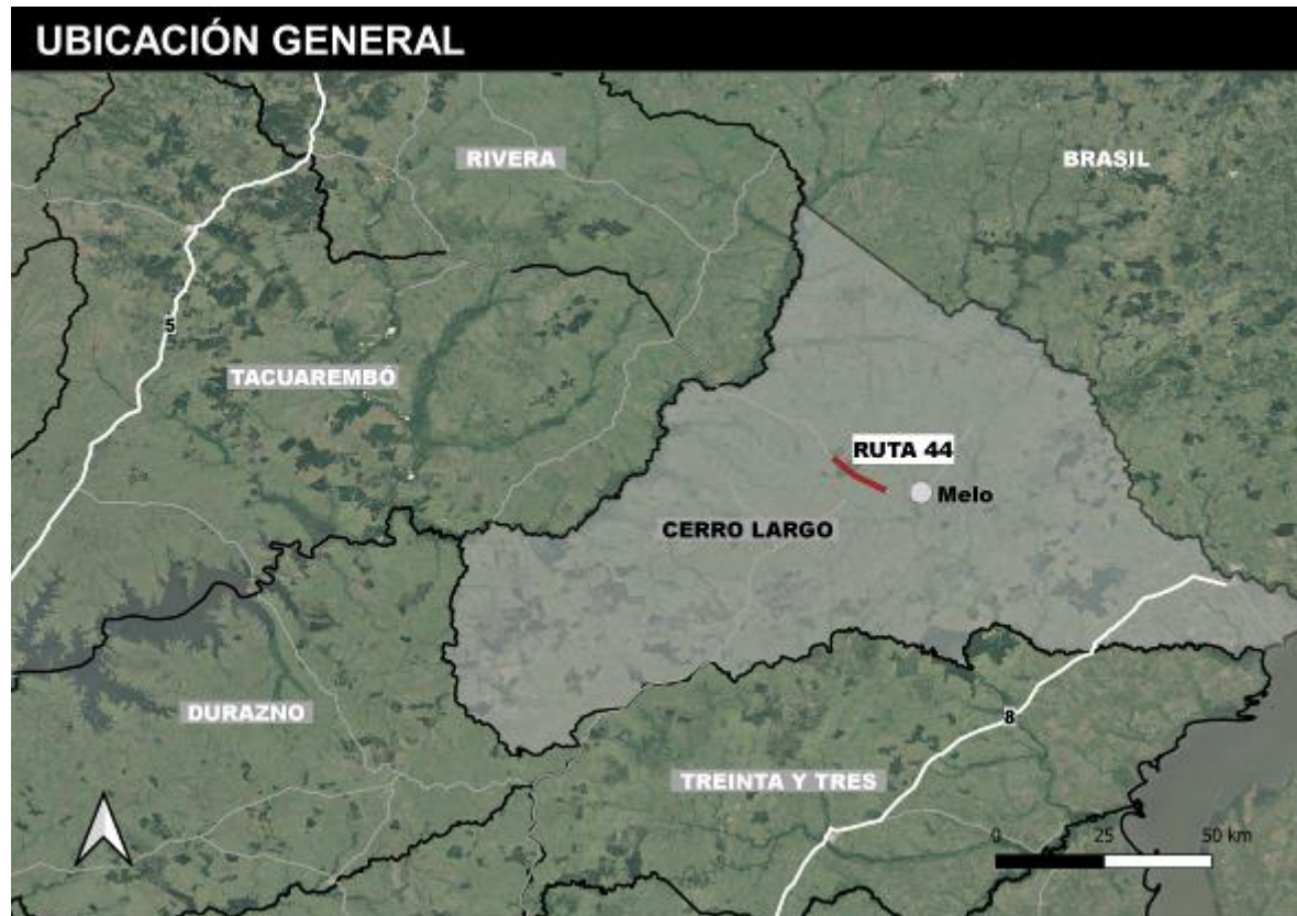
Figura 4-1 Ubicación de la obra.