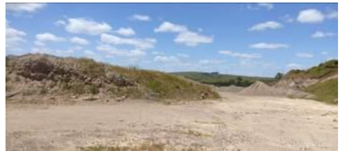
Foto 12.2-1 Predio de Planta de Asfalto en etapa de Recuperación Ambiental.