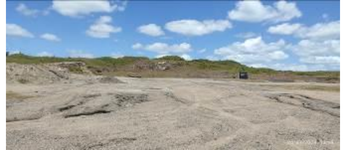
Foto 12.4-1 Vistas del predio de planta de asfalto.