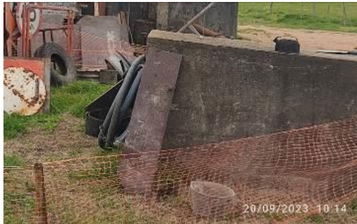
Foto 12.3-1 Neumático y otros recipientes con agua estancada.