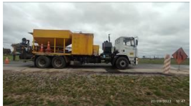
Foto 12.7-1 Bacheo, Ruta 86.