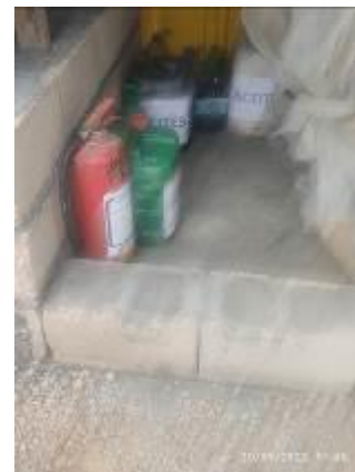
Foto 12.8-1 Obrador Ruta 63 -Puente Arroyo Tala.