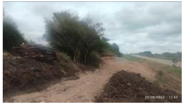
Foto 12.5-1 12.5-2 Estructura de Obrador en Ruta 63 encimadas a la vegetación existente.