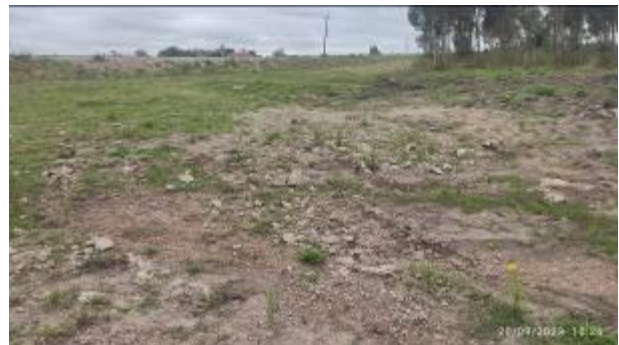
Foto 12.2-1 Restos de escombros de alcantarillas.