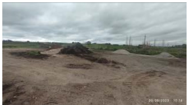
Foto 12.6-1 Obrador OSUSA Ruta 86.