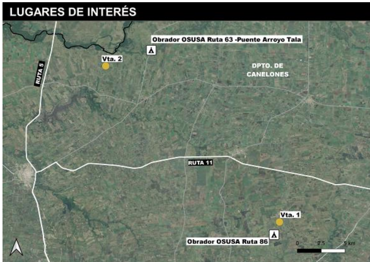
Figura 5-1 Lugares de interés.