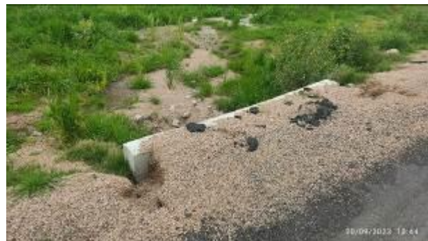
Foto 12.4-1 Restos de materiales y erosión en alcantarilla de Ruta 86.