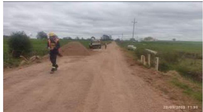
Foto 12.9-1 Vta.2 Construcción de alcantarilla Ruta 63.