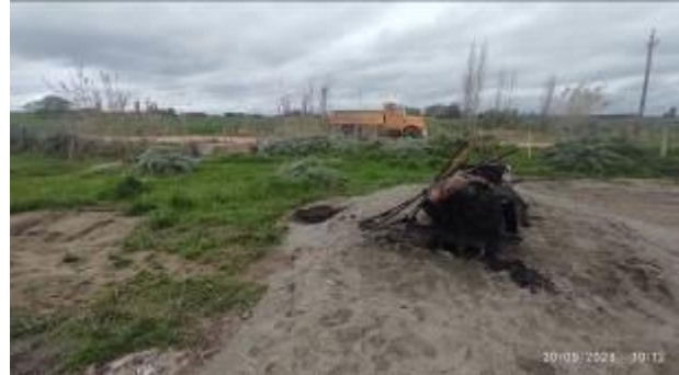
Foto 12.1-1 Derrame de hidrocarburo.