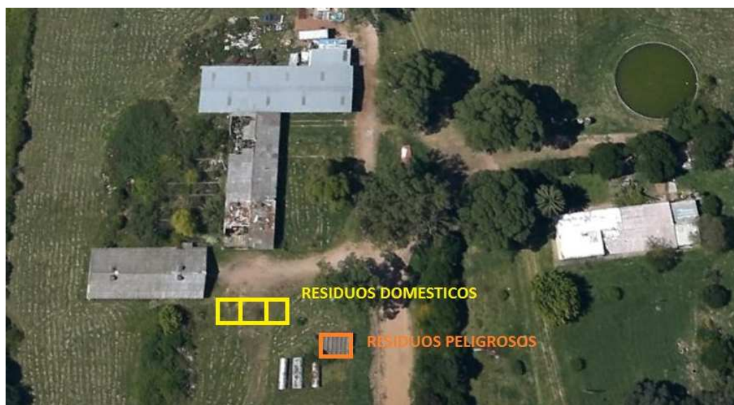
Detalle de ubicación residuos domésticos y peligrosos