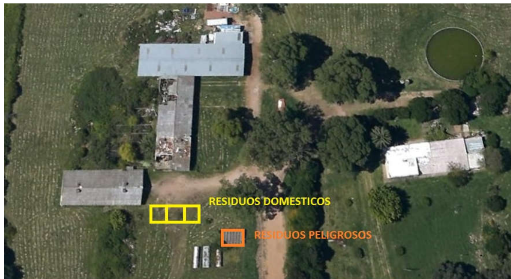
Detalle de ubicación residuos domésticos y peligrosos