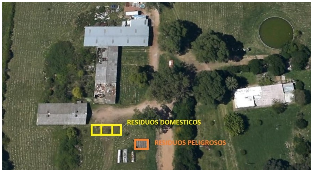
Detalle de ubicación residuos domésticos y peligrosos