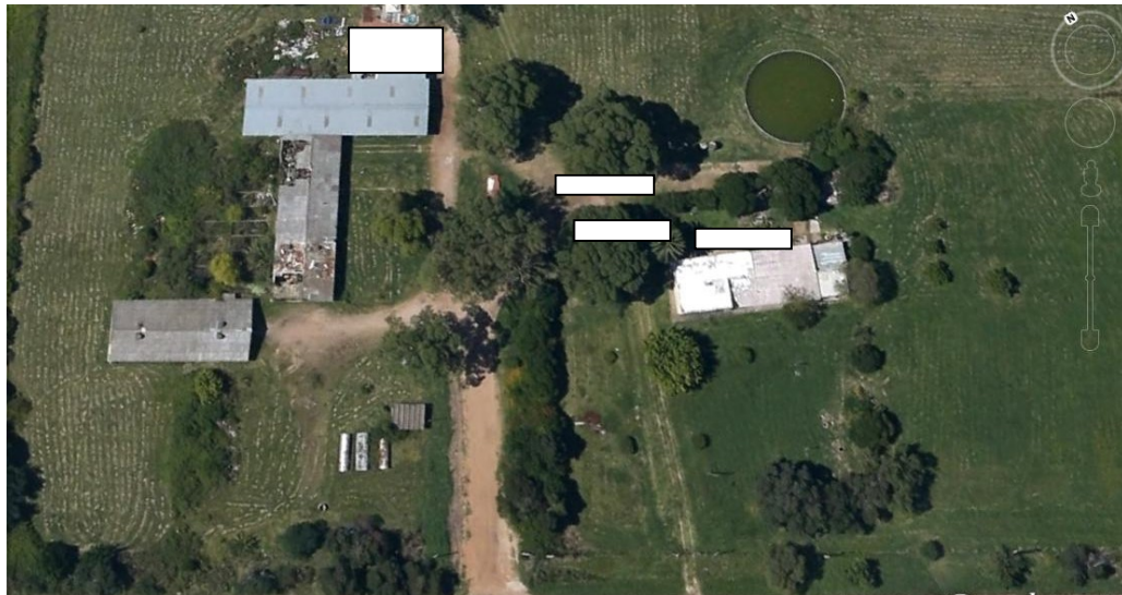
Detalle de ubicación de contenedores de oficina y depósitos