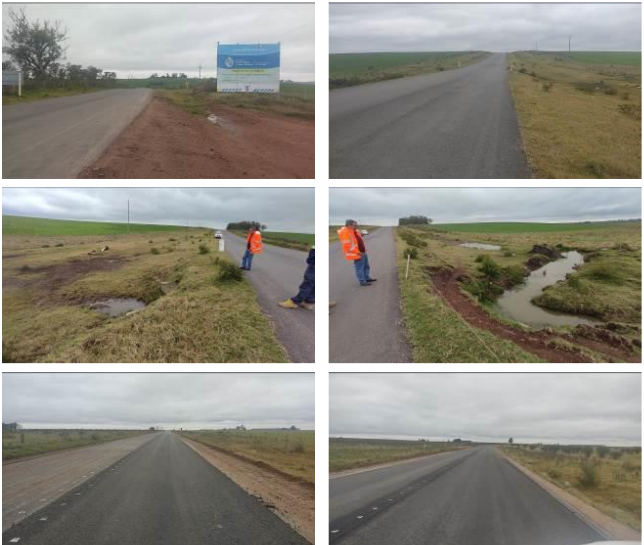
Foto 13.1-1 Vistas del tramo en obra.