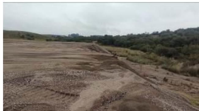
Foto 13.2-1 Planta Asfáltica.