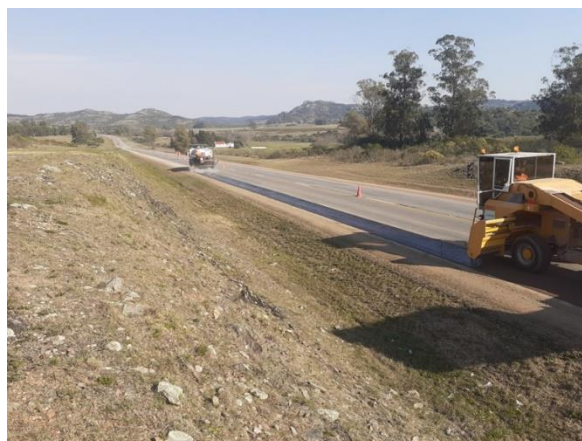
imprimación de banquetas cementadas en Obras N°1 N°2