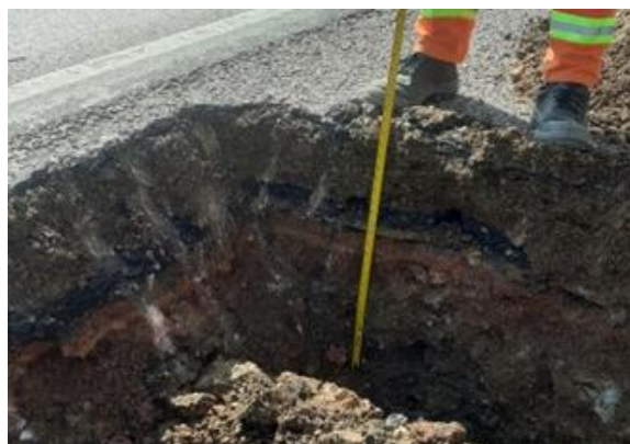
Construcción de enanches para terceros carriles en km 125 y km 130. - TEMS