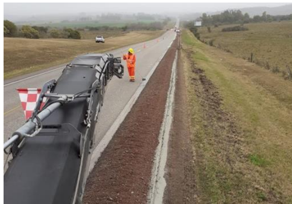
Reciclado de banquetas en Obras N°1 y N°2