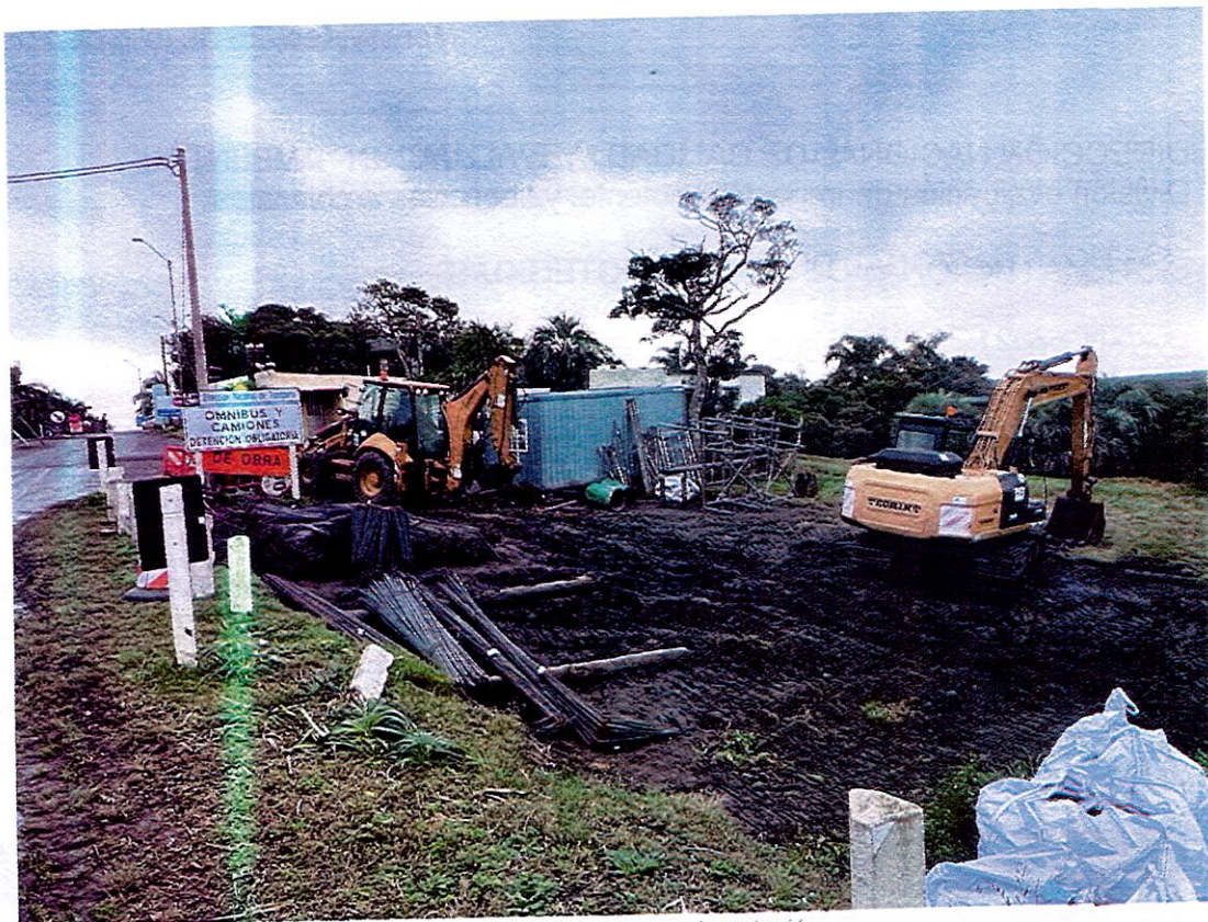
Ilustración 2 Obrador en instalación