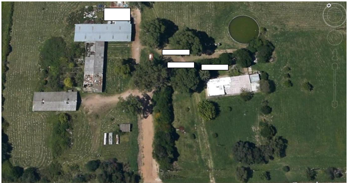
Detalle de ubicación de contenedores de oficina y depósitos