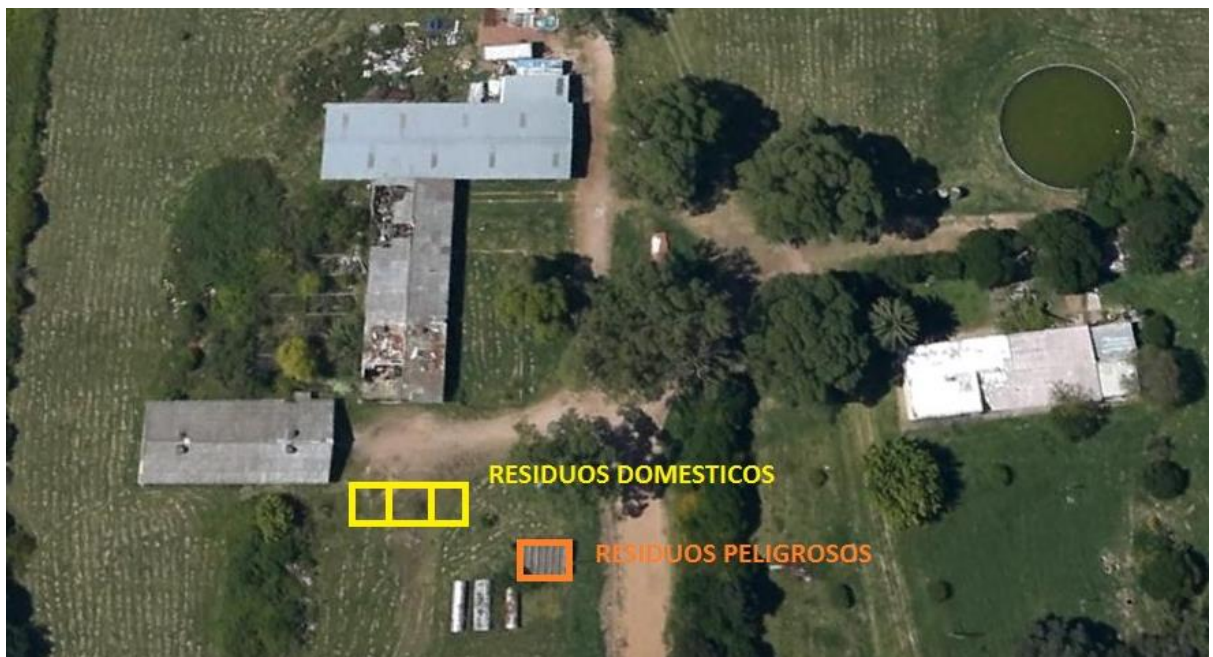
Detalle de ubicación residuos domésticos y peligrosos