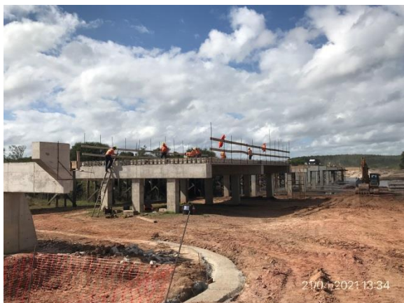
Ilustración 12 – P02, Puente en obra. Trabajos en tablero superior.