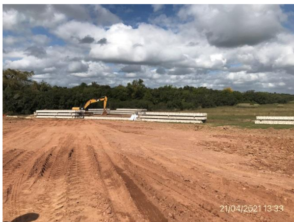
Ilustración 10 – P01, Obrador. Manipulación mecánica de vigas prefabricadas.