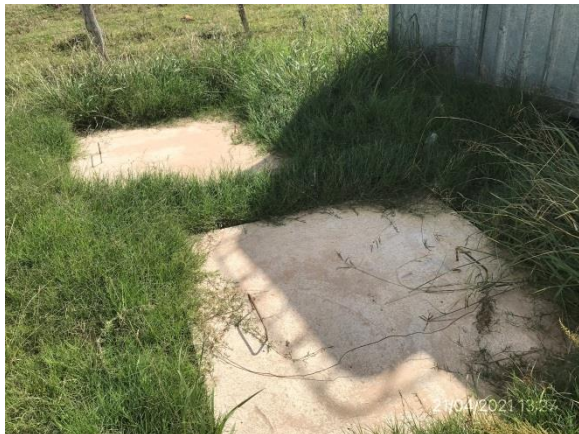
Ilustración 4 – P01, Obrador. Pozo impermeable.