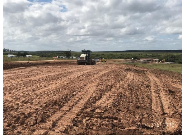
Ilustración 17 – P02, Puente en obra. Obras de movimientos de suelo en acceso Sur al puente, subcontrato Meliter SA.