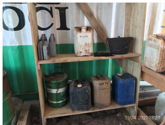
Ilustración 7 – P01, Obrador. Sector de acopio de lubricantes con pavimento y envallado impermeables.