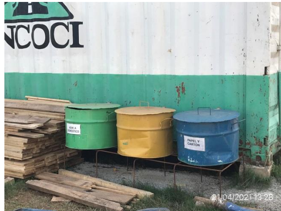
Ilustración 5 – P01, Obrador. Contenedores con tapa para segregación de residuos por origen de generación.