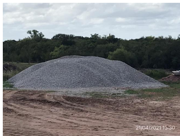
Ilustración 9 – P01, Obrador. Acopio de agregados para hormigón.