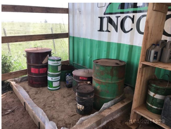
Ilustración 6 – P01, Obrador. Sector de acopio de lubricantes con pavimento y envallado impermeables.