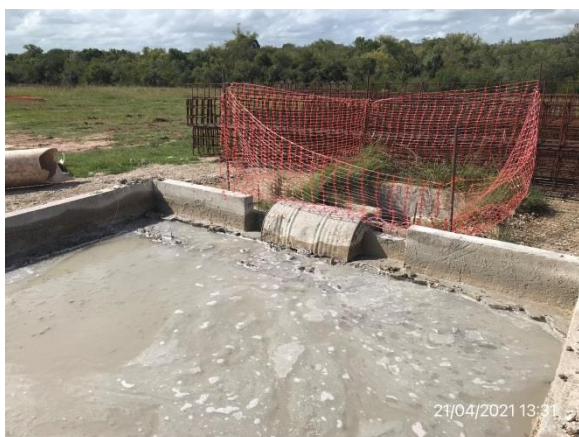
Ilustración 8 – P01, Obrador. Pileta de lavado de camiones mixer con recirculación de aguas de lavado.