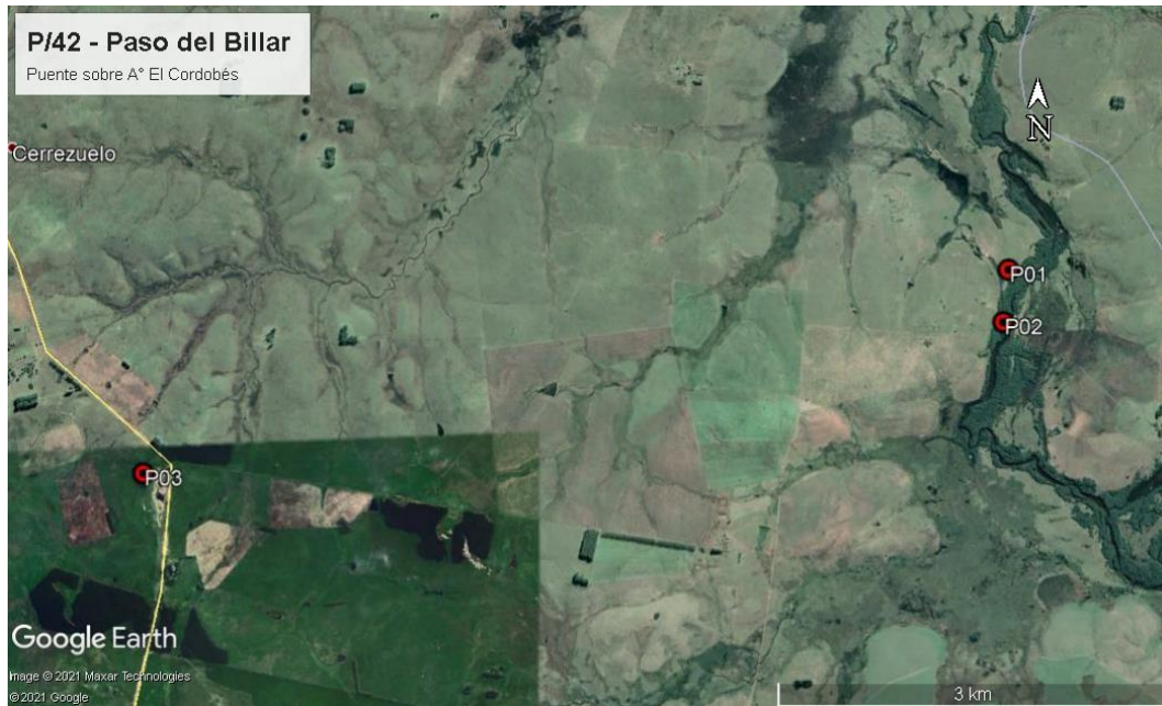
Ilustración 3 –Puntos destacados del contrato