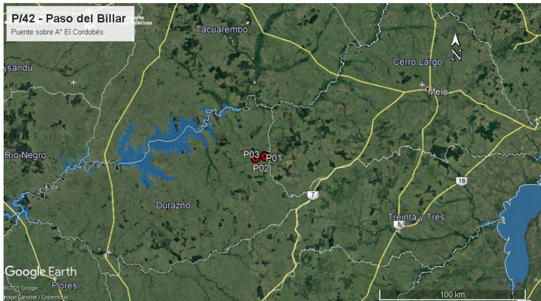
Ilustración 2 - Ubicación del contrato a nivel departamental.