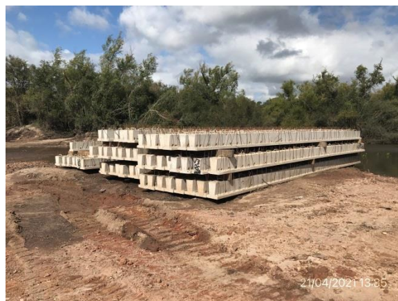
Ilustración 11 – P01, Obrador. Acopio de vigas prefabricadas.