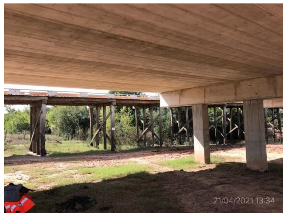
Ilustración 13 – P02, Puente en obra. Vano terminado.