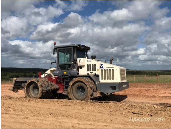
Ilustración 16 – P02, Puente en obra. Obras de movimientos de suelo en acceso Sur al puente, subcontrato Meliter SA.