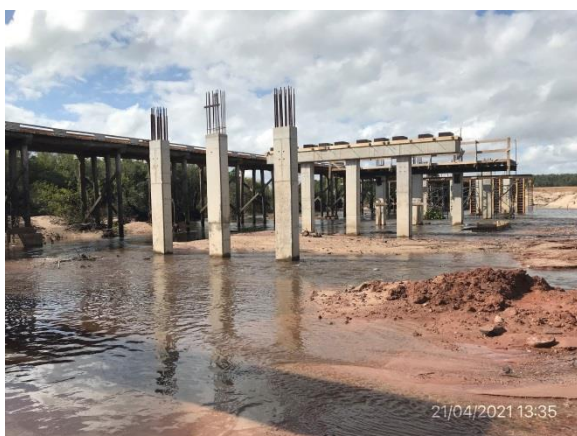
Ilustración 14 – P02, Puente en obra. Cauce del A° Cordobés.