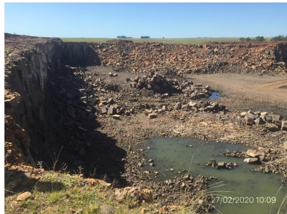
Ilustración 7 – P03, Cantera desactivada con autorización del DDO para la no realización de las tareas de recuperación previstas en el PRA