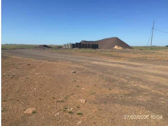
Ilustración 4 – P03, Obrador en desuso, acopios de áridos