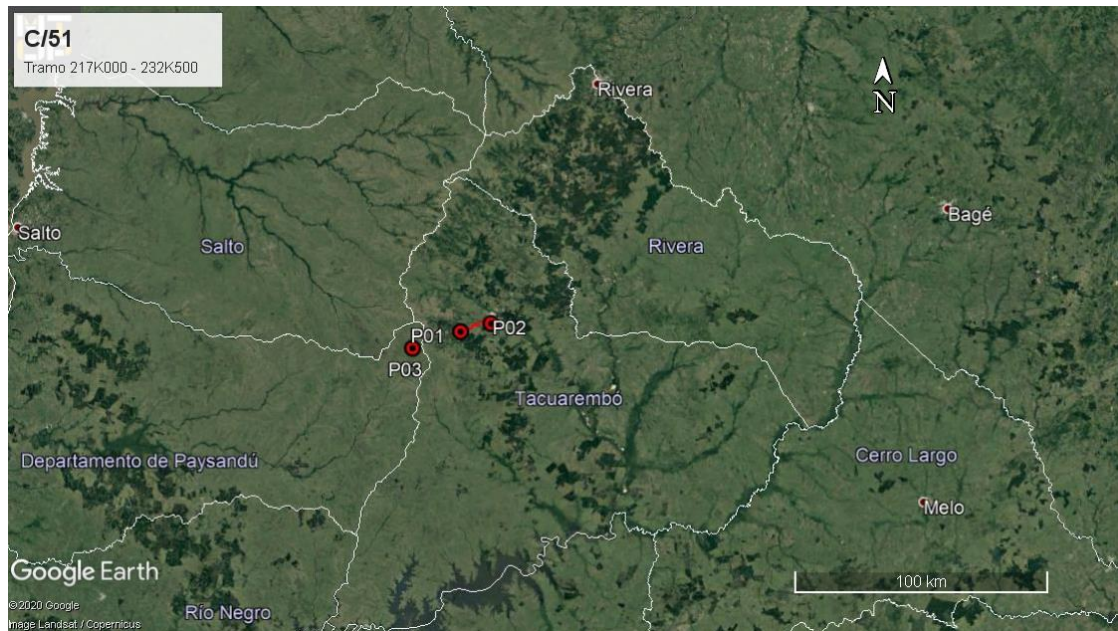
Ilustración 2 - Ubicación del contrato a nivel departamental.