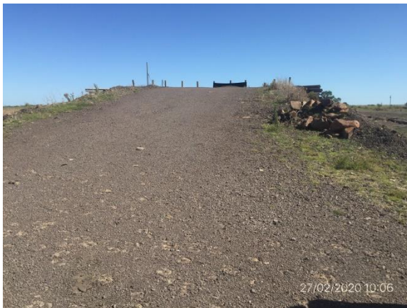
Ilustración 6 – P03, Obrador en desuso, rampa de acceso a planta de trituración