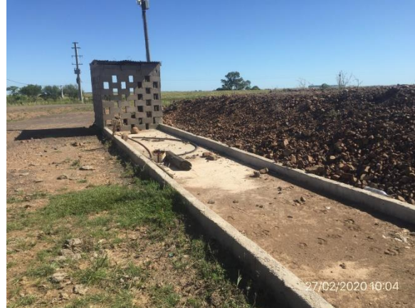
Ilustración 5 – P03, Obrador en desuso, zona de acopio de combustible