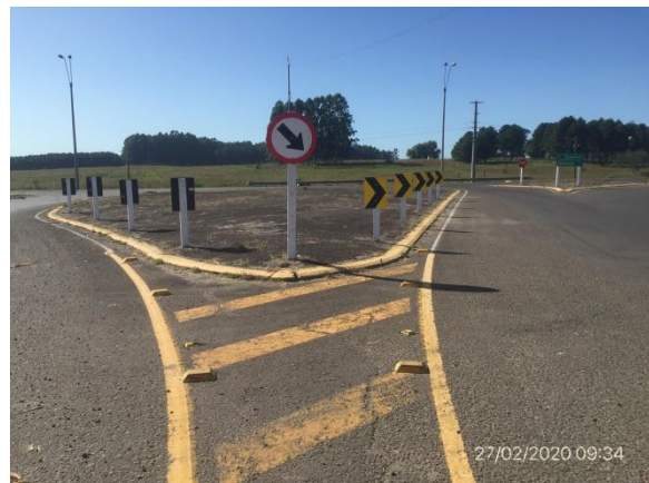
Ilustración 9 – P02, Fin de tramo, rotonda de empalme de Ruta 26 con accesos a ciudad de Tacuarembó