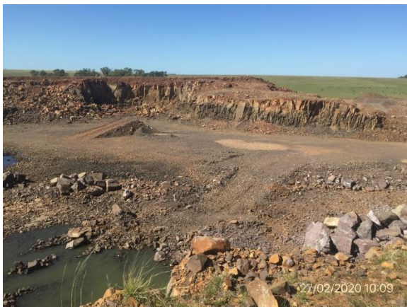
Ilustración 8 – P03, Cantera desactivada con autorización del DDO para la no realización de las tareas de recuperación previstas en el PRA